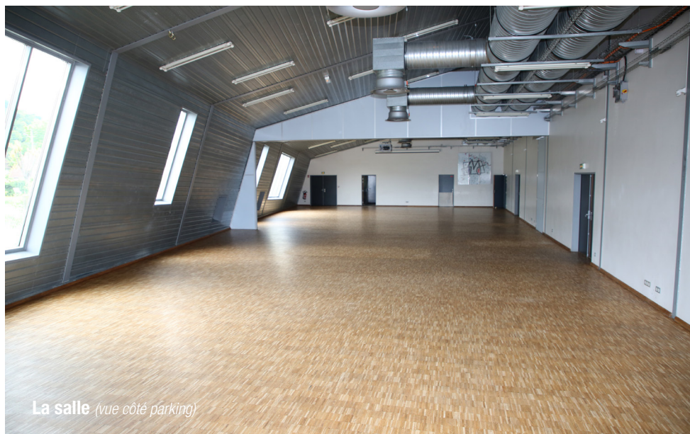
La salle (vue côté parking)