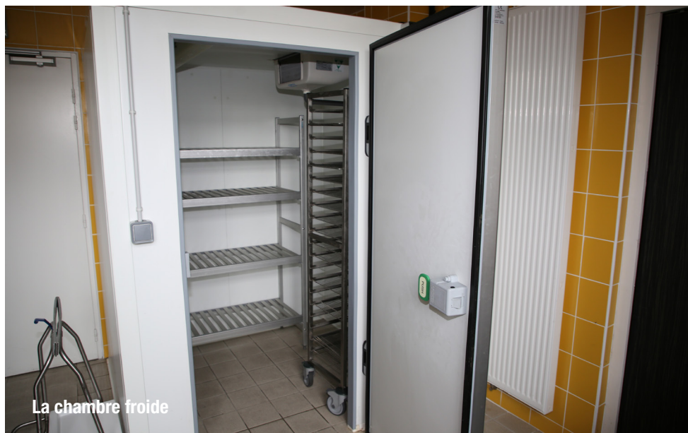
La chambre froide