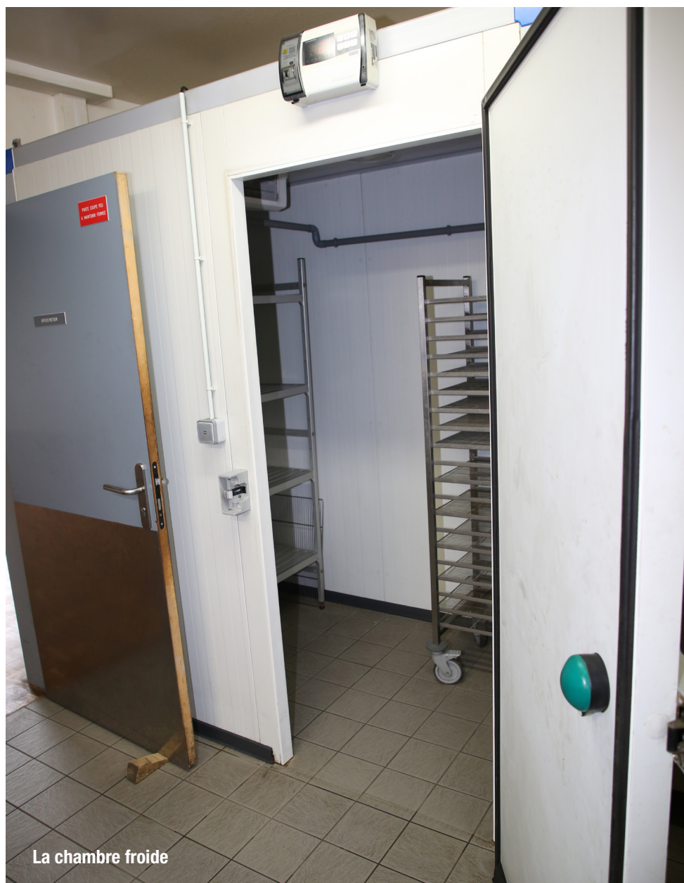
La chambre froide