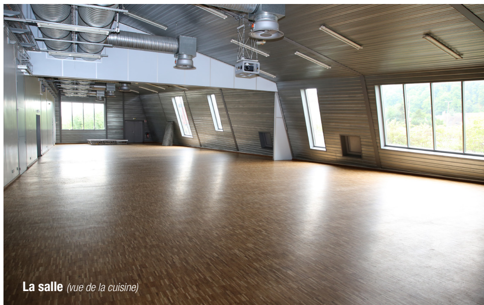
La salle (vue de la cuisine)