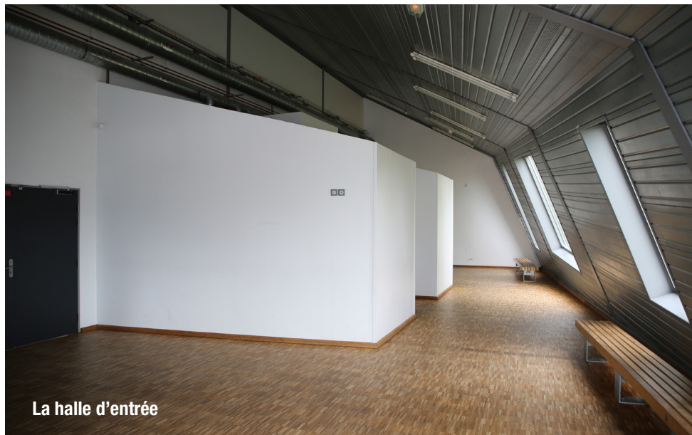
La halle d'entrée