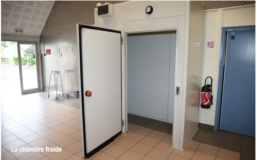
La chambre froide