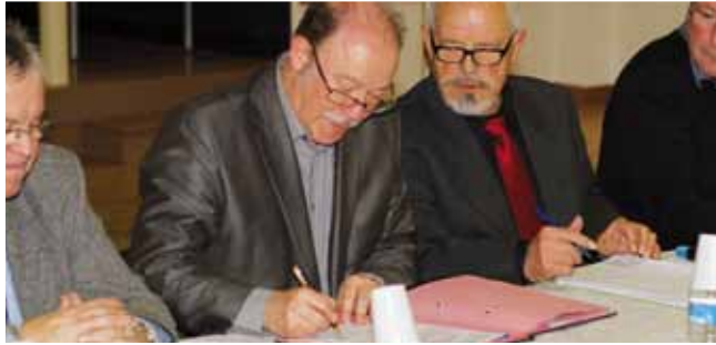
19 janvier Signature de la convention de partenariat entre la ville et les Martins Pêcheurs pour l'entretien de l'étang de la Maladrerie.