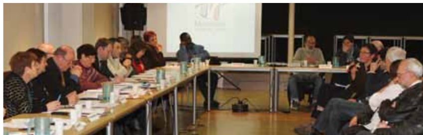
Lors du débat d'orientation budgétaire le 3 février dernier.

manœuvre se resserrent de plus en plus. Dans cette situation difficile, le budget 2014 maintient les services municipaux et cherche même à les développer, pour continuer de répondre aux besoins de la population. ■