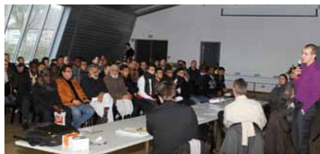
28 janvier Forum d'information sur l'emploi à l'Espace de Rencontres de Montataire