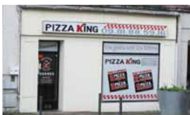
Pizza king • Pizzeria Rue Jean Jaurès