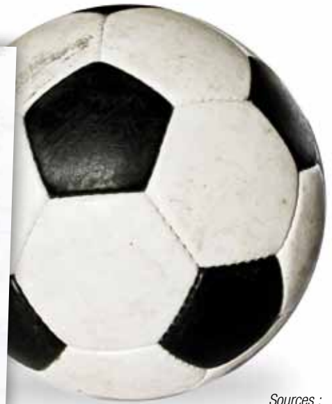
Sources : Le club de football, le S.A.C. : Standard Athlétique Club de Montataire, a été créé en 1908.