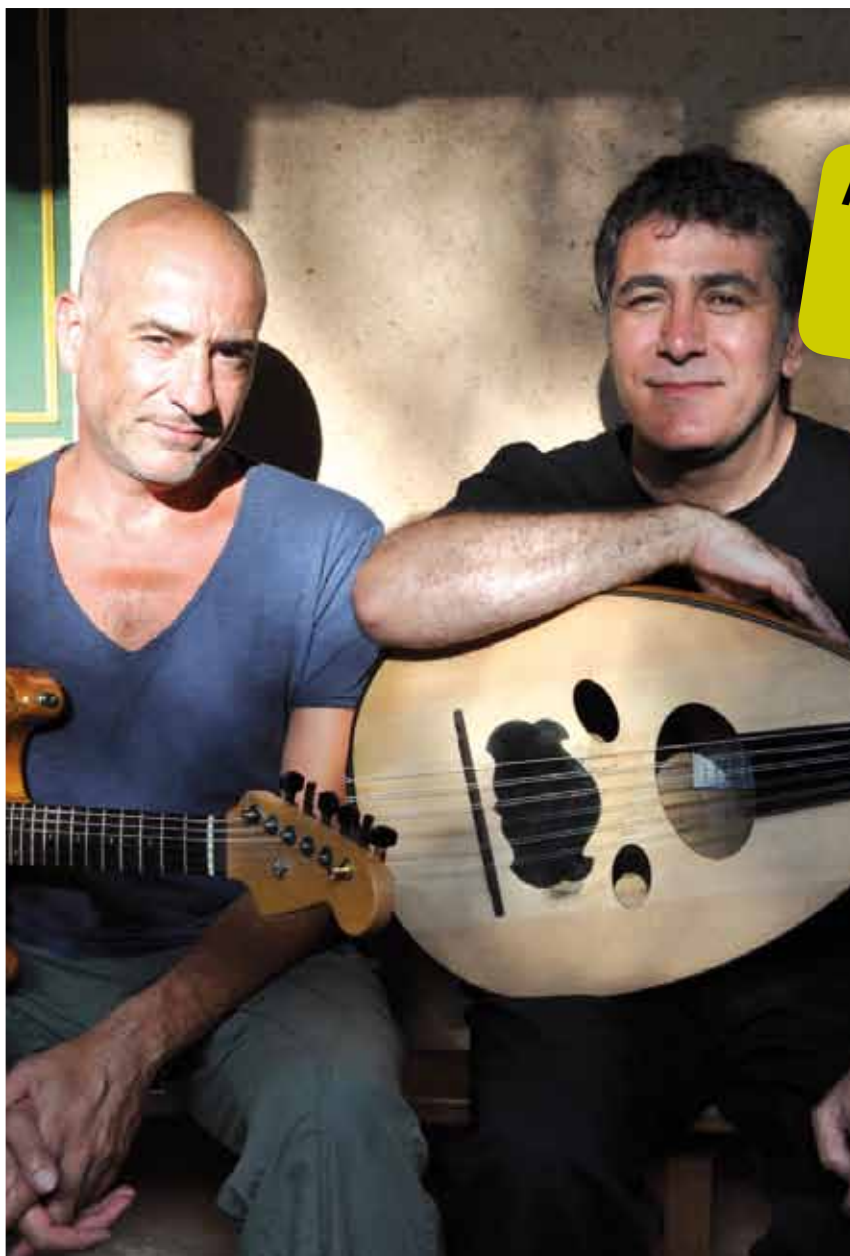
Un duo poésie

"...Le dialogue entre les deux instruments se fait donc dans le respect de la langue musicale de chacun, loin des fusions qui gommant les différences et aseptisent..."