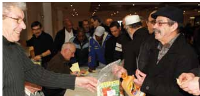
2 février Assemblée générale de la société ouvrière d'horticulture et de tempérance et distribution des graines à leurs adhérents.