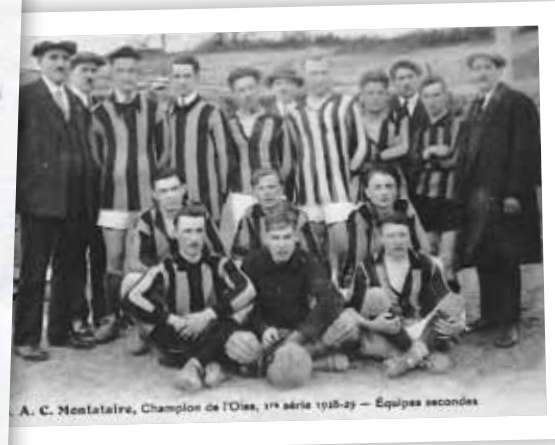
A. C. Montataire, Champion de l'Oise, 1 re série 1928-29 — Équipes secondes