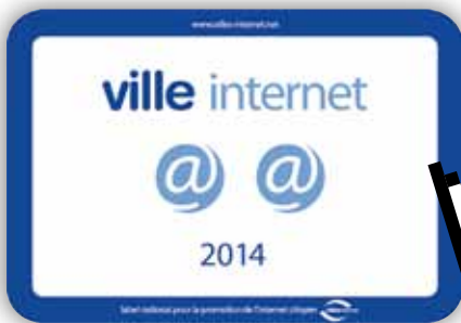
19 février La ville a été labellisée "Ville internet @@" pour sa première participation !