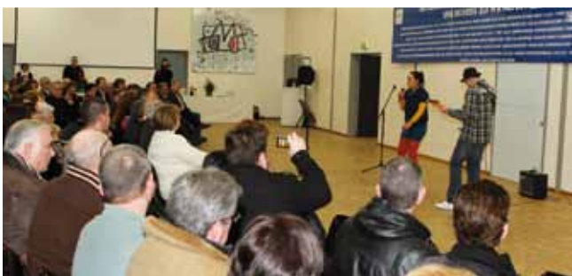
25 janvier Rencontre de la vie associative à l'Espace de Rencontres