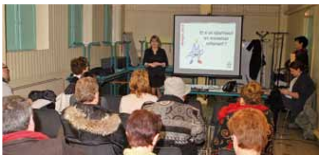
13 février Rencontre du budget avec les commerçants.