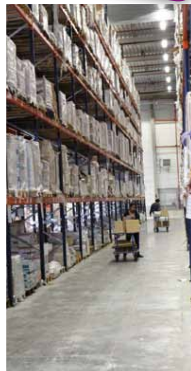
Une entreprise des marches de l'Oise

Ce dernier évoque aussi la classification du site en zone franche urbaine (ZFU) qui n'est pas étrangère au choix de l'installation de l'entreprise : puisque les sociétés qui s'implantent en ZFU et qui embauchent une main-d'œuvre locale peuvent bénéficier, sous conditions, d'exonération de charges fiscales et sociales. "Les Marches de l'Oise permettent de s'implanter tout en évoluant dans le temps" : arrivé en 2006 sur les Marches de l'Oise, Doc Sourcing n'a cessé de s'agrandir sur le site passant d'un à quatre bâtiments avant d'obtenir discussion avec CMD, la construction d'un unique bâtiment correspondant à leurs besoins de stockage. À l'heure actuelle, 108 entreprises constituent le site soit près de 1100 emplois qui font les Marches de l'Oise, transformant ce qui aurait pu devenir un désert grisâtre en un véritable essaim économique qui ne cesse de croître. ■