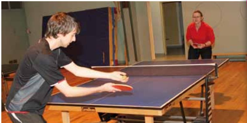
Le tennis de table, une activité dynamique !

La pratique du tennis de table est ancienne à Montataire puisque dès les années 80 avec le ping pong club de Montataire (PPCM), nombre de Montatairiens ont pu pratiquer cette discipline de loisir et de compétition. Mi 90, le PPCM finit par s'essouffler et c'est pour garder cette pratique sur la ville que naît l'amicale tennis de table de montataire (ATTM).