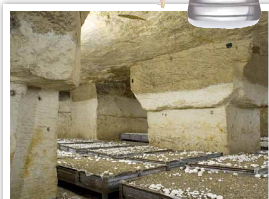
Champignonnière de Montataire