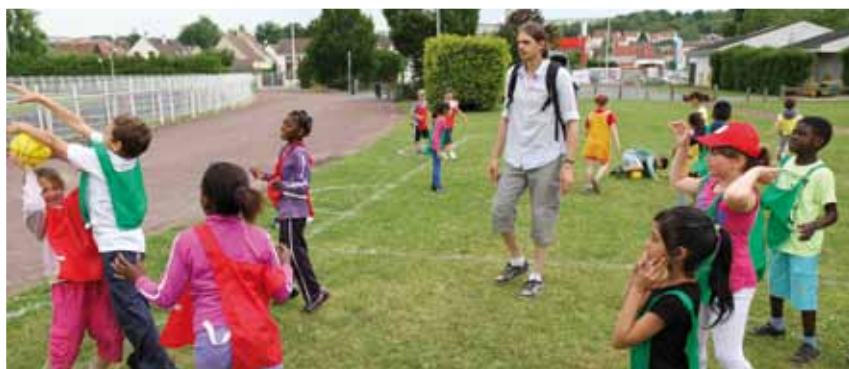
Prêts pour le rallye citoyen le 16 mai prochain

Cette course d'orientation qui s'étalera sur la journée du samedi 16 mai 2014, permettra aux enfants de [re]découvrir le patrimoine de leur ville ; aménagements verts, différents sites culturels, patrimoine, les organisateurs préparent une course toute teintée de développement durable et de citoyenneté. Nous reviendrons bien évidemment sur cette journée avec une réalisation vidéo de votre chaîne TvAime. ■