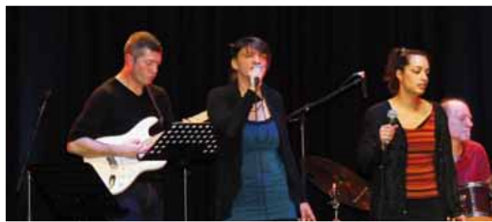
2 février Concert des professeurs de l'AMEM au Palace