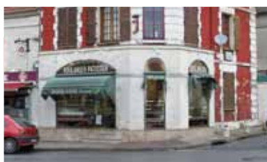
Boulangerie (changement de propriétaire) Place August Génie