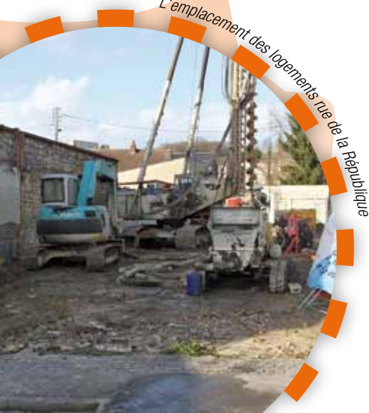
L'emplacement des logements rue de la République

Elle portait sur des problèmes de stationnement anarchique devant les accès aux garages. Oise Habitat a procédé à la mise en place de panneaux supplémentaires sur les portes des garages interdisant le stationnement devant. La municipalité s'est engagée dès le printemps 2014, à renforcer les règles d'interdiction par un marquage au sol adapté. Un système empêchant le stationnement intempestif face aux garages, est actuellement à l'étude par les services techniques ; il pourrait s'agir d'arceaux ou de potelets. ■